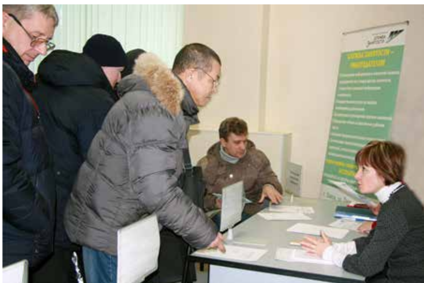
На снимке: ярмарка вакансий на Тарской, 11.