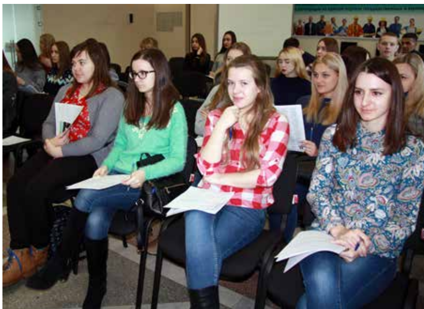
На снимке: старшекурсников Омского юридического колледжа в информационном центре службы занятости на Тарской, 11 научили составлять резюме и познакомили с запросами местного рынка труда.

УЧЕНЫЙ СОВЕТ – обучение и повышение квалификации – стр. 16